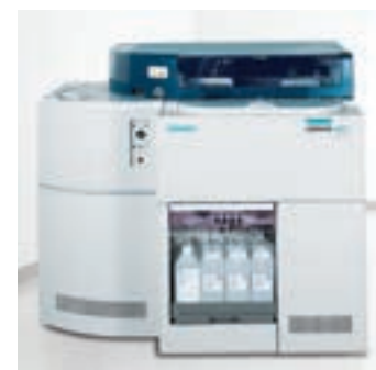
ADVIA® 1200 Chemistry System