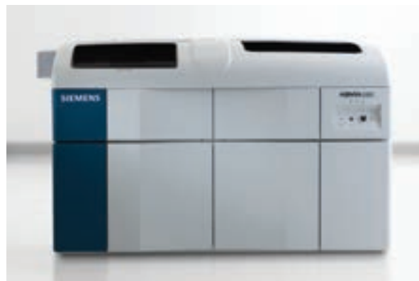
ADVIA® 2400 Chemistry System

A Tecnologia VeriSmart™ combina controles de hardware e software que funcionam em harmonia para assegurar a precisão dos resultados dos testes sem interromper o fluxo de trabalho.