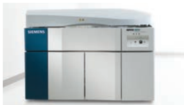
ADVIA® 1800 Chemistry System