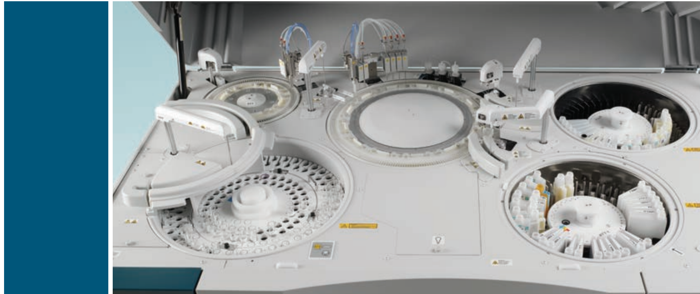
Tecnologia Point-in-space: a probe primária pode deslocar-se até 225°, para amostragem sem a necessidade de uma interface robótica adicional

Apresentamos a Tecnologia VeriSmart, um sistema de verificação de processos que oferece novos níveis de precisão aos testes químicos. Através da integração de controles de hardware e software em todos os estágios do processamento das amostras, a Tecnologia VeriSmart fornece resultados confiáveis, teste após teste. E já que possui todas as funções avançadas do sistema ADVIA® Chemistry, você também obterá uma eficiência, confiabilidade e produtividade incomparáveis. Faça uma escolha VeriSmart para o seu laboratório – opte por ADVIA Chemistry.